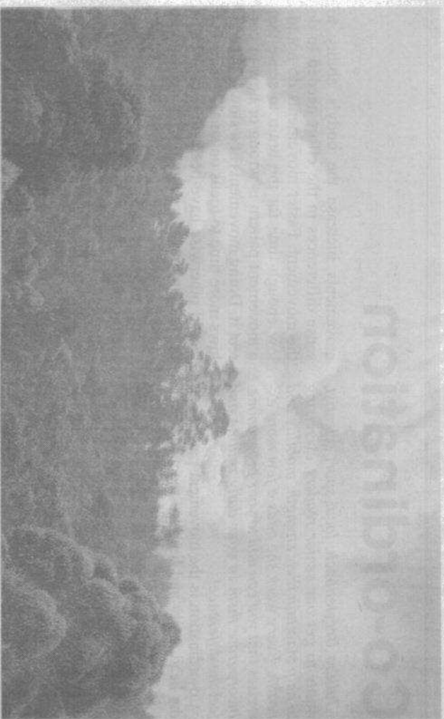
A fynbos fire in Tsitsikamma.

SCFPA members receive up-to date fire index information, and, through the FPA, can